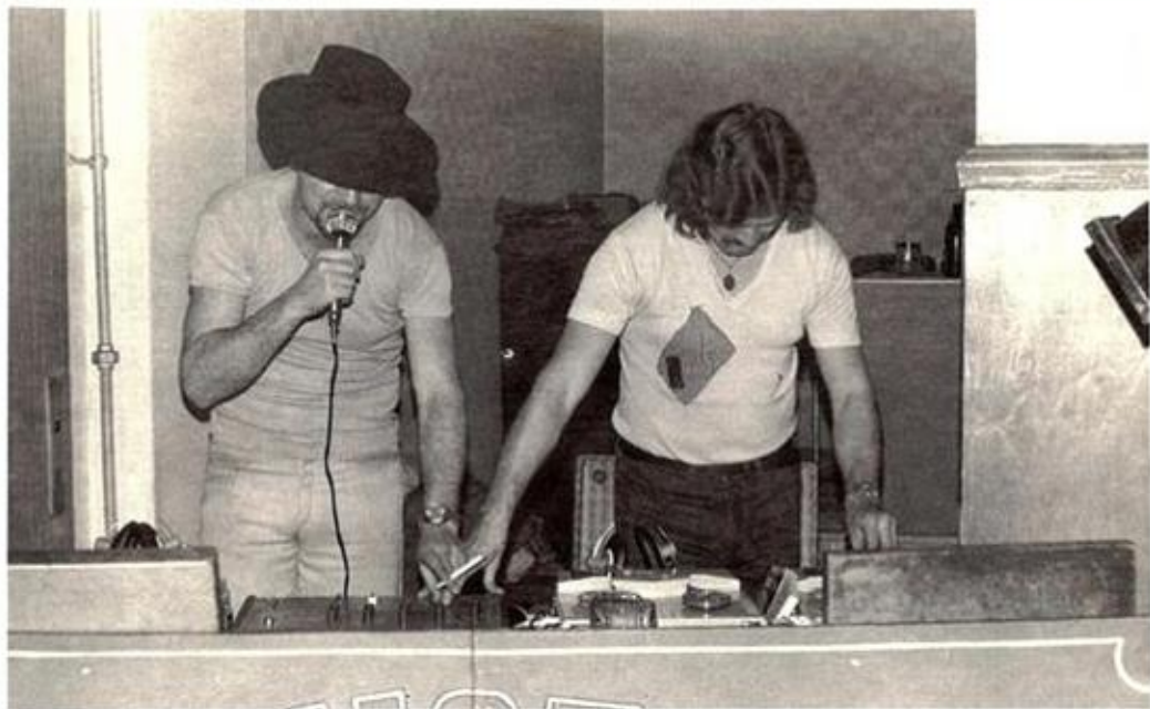
Unsere Disko „Phonothek“-Dresden