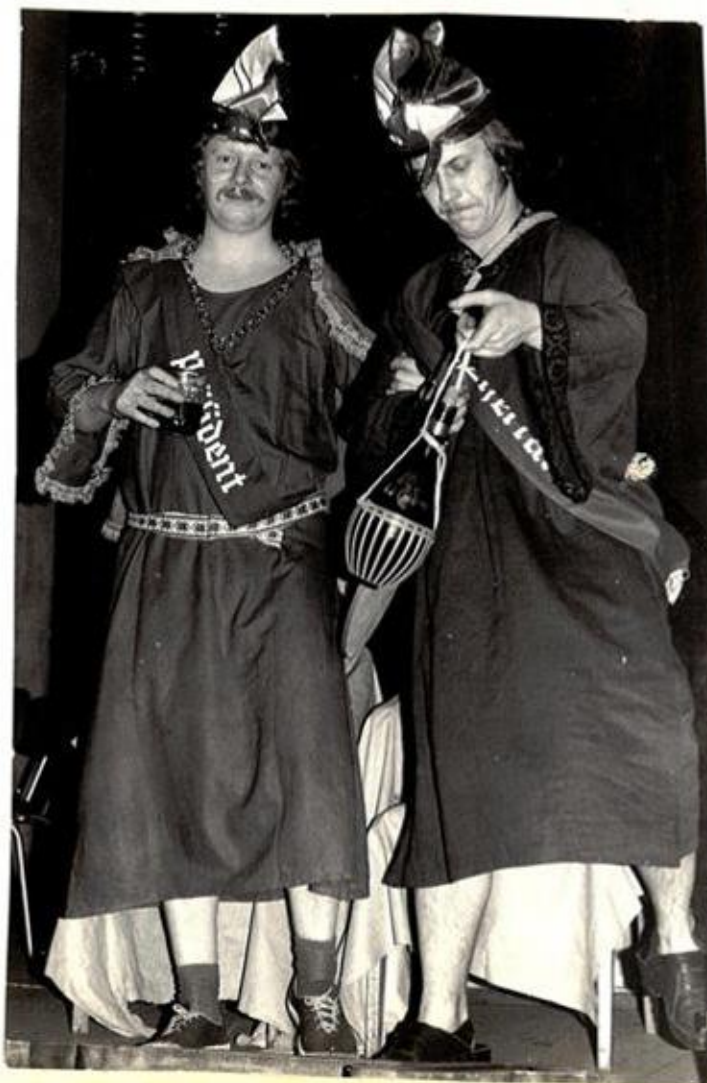
Auszeichnung der besten Kostüme und Ordensverleihung!