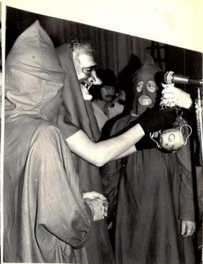
Bei der Bühnenrede!