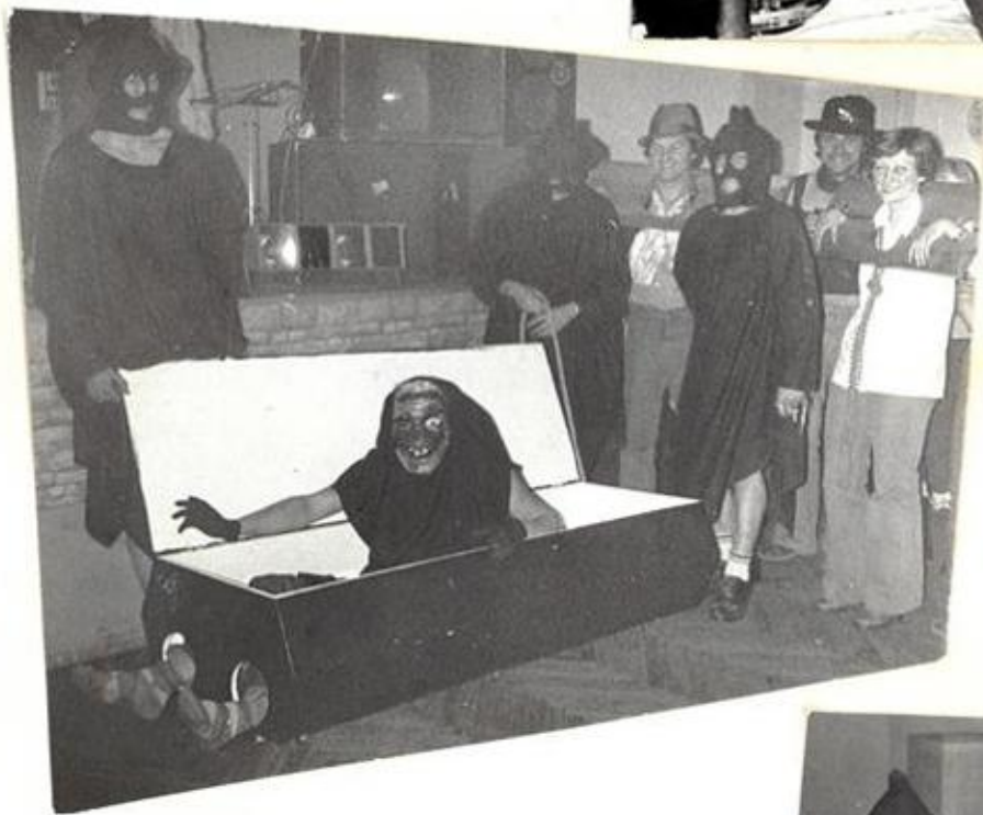
Die Henker mit Gefangenen und Sarg