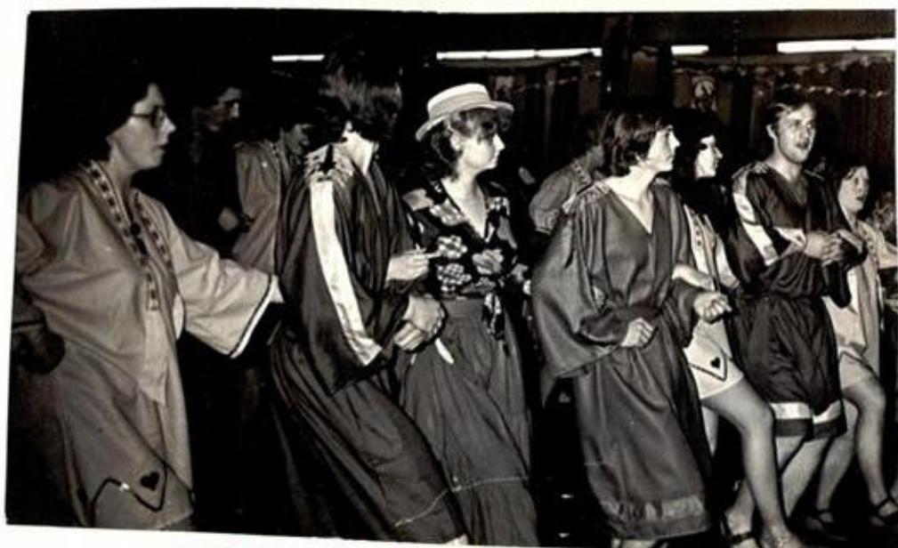
Elferrat, Funken, Polizei, Stimmung im Saal!