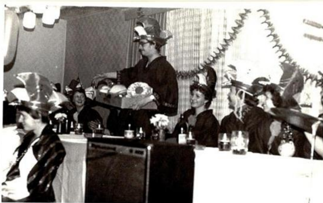
Der Bauchladen bewährt sich! Eröffnungstanz des Eherrates!