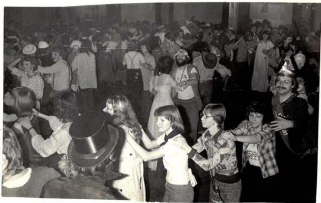
Die große Polonaise